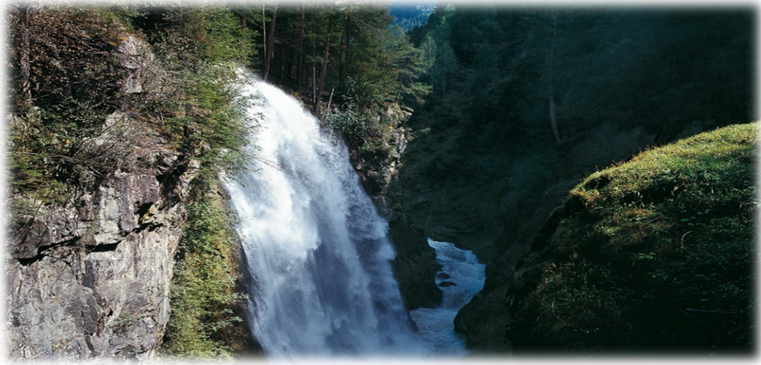
Immagine: Cascate di Riva di Tures

che sul "Tristennöckl", alto 2.646 metri, sopra la Kasseler Hütte, si trova il più alto stand di pini cembri delle Alpi orientali.